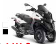
Fuoco LT 500 ie